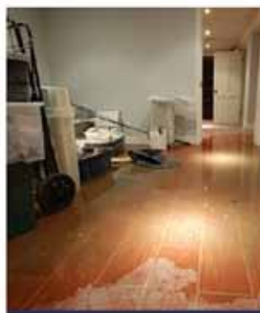
SERVICE D'URGENCE 24H/24 7J/7