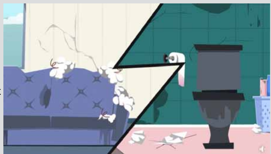
Encore une autre année de saccages en vue : Projet de loi 31, incomplet pour protéger les propriétaires