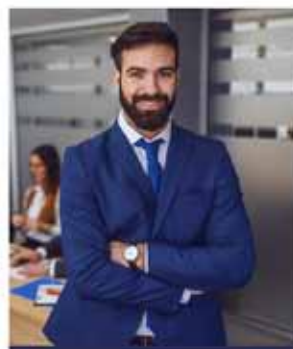
GESTIONNAIRES QUALIFIÉS, DISPONIBLES ET EFFICACES

UNE ÉQUIPE PROFESSIONNELLE À VOTRE ÉCOUTE POUR UNE GESTION SAINTE DE CE QUI VOUS TIENT À COEUR!