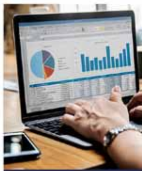
ACCÈS EN TEMPS RÉEL AUX OPÉRATIONS DE GESTION ET DE COMPTABILITÉ POUR LES ADMINISTRATEURS